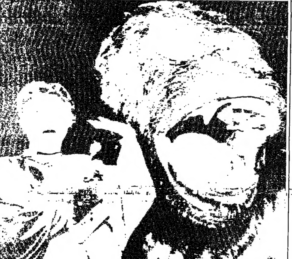
الممثلة فاي راي تعود لتلقي كينغ كونغ. خلال مؤتمر صحفي عقد في ستوديوهات يونيفرسال امس الاول، يقصد الترويج لفيلم «من تلحية اخرى، التي تتناول سيرتها الذاتية. راي كانت قامت بدور البطولة في فيلم «كينغ كونغ» الاصل عام ١٩٣٣ لندن - ا ف ب (دويتز)